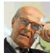
Oncologo Umberto Veronesi